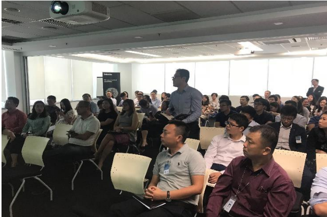
图为研习会期间中资企业嘉宾们踊跃发问