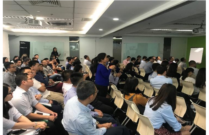
图为研习会期间中资企业嘉宾们踊跃发问