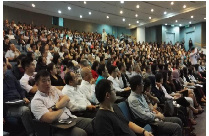
图为研习会期间中资企业嘉宾们认真聆听