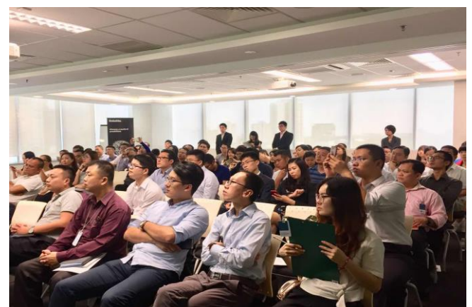
图为研习会期间中资企业嘉宾们认真聆听