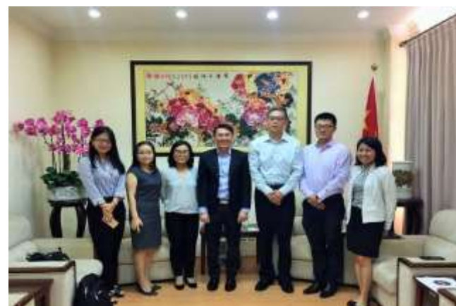
图为德勤马来西亚团队与中国驻马来西亚古晋总领事馆的张阳副总领事（左三），商务领事李先生（右二）、副商务领事沈先生（最右）于总领事馆合影