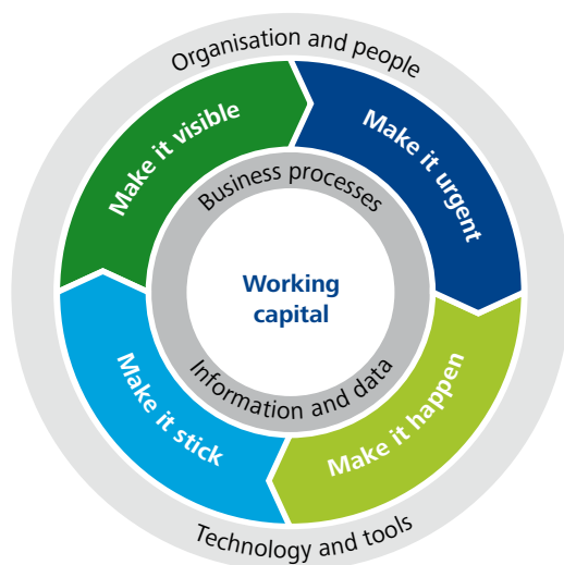
Figuur 2: de OWC methode

Deloitte heeft een gestructureerde aanpak ontwikkeld waarmee we samen met u succesvolle, duurzame verbeteringen kunnen doorvoeren ten aanzien van uw werkkapitaal. Om er zeker van te zijn dat werkkapitaal bij iedereen prioriteit blijft houden, worden de relevante afdelingen als Inkoop, Logistiek, Administratie en Verkoop bij deze aanpak betrokken. In een werkkapitaaltraject worden diverse verbetergebieden die nauw verbonden zijn aan de cash conversion cycle ook in ogenschouw genomen. Denk hierbij bijvoorbeeld aan het optimaliseren van de onderhouds & bedrijfsvoering strategie om zo efficiënt mogelijk met reserve onderdelen om te gaan.