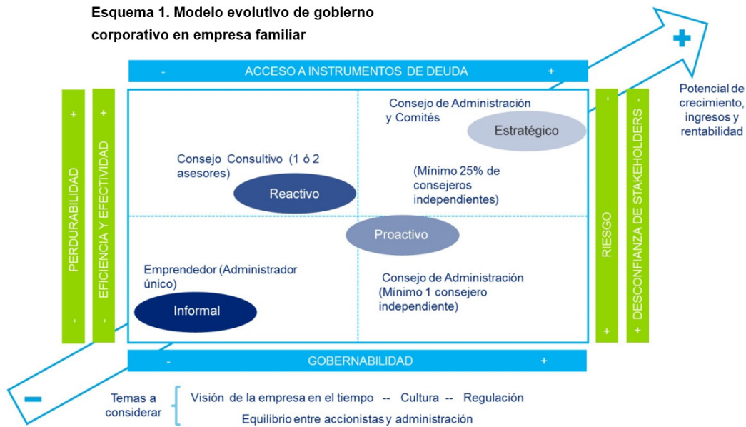
Esquema 1. Modelo evolutivo de gobierno corporativo en empresa familiar