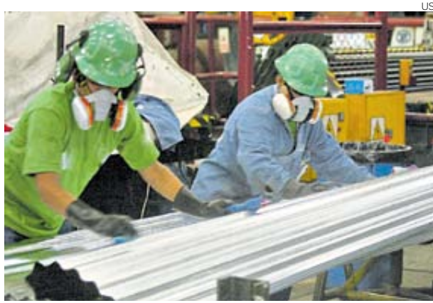
Formalización. MEF cree que rebaja del IGV ayude a formalización.

En este paquete también se busca dar facilidades para que los capitales que salieron del Perú desde fines de los 60 y no tributan, puedan retor-