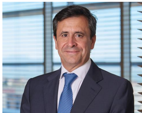
Joaquim Paulo Partner Financial Advisory | Forensic

Esperamos que este estudo seja uma ferramenta útil para os líderes organizacionais, no sentido de os ajudar a entender melhor os riscos e a exposição à fraude da sua organização, bem como a melhorar a sua capacidade de prevenção e mitigação deste tipo de risco.