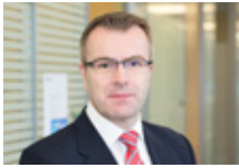
Иан Коулберн Главный исполнительный директор «Делойт» СНГ