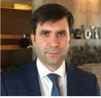
Av. Şenol Kocaer DL Avukatlık Bürosu

6698 sayılı Kişisel Verilerin Korunması Kanunu'nun yürürlüğe girmesi ile birlikte Vergi İdaresi'nin elde ettiği mali bilgilerin güvenliğinin sağlanması önemli konulardan biri haline gelmiştir.