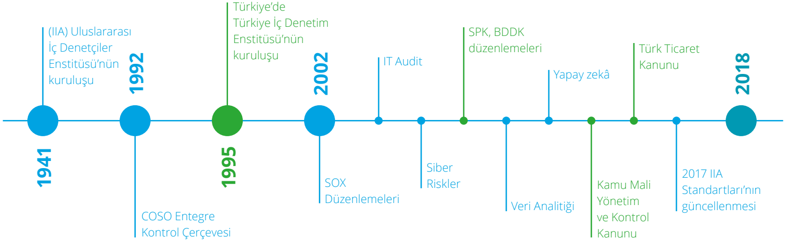
Çizelge 1: Internal Audit 3.0 The Future of Internal Audit is now, çalışmasından uyarlanmıştır. (*)

Çağımızın dili olan kodlama jargonuyla ifade edersek, iç denetim mesleğinin geleceği İÇ DENETİM 3.0'dan geçiyor.