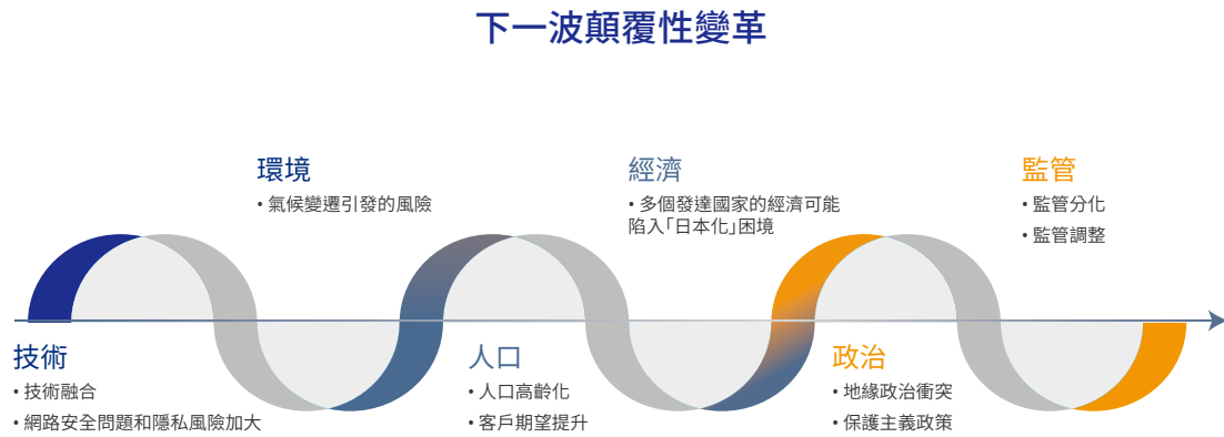
圖1 銀行與資本市場產業的顛覆性變革