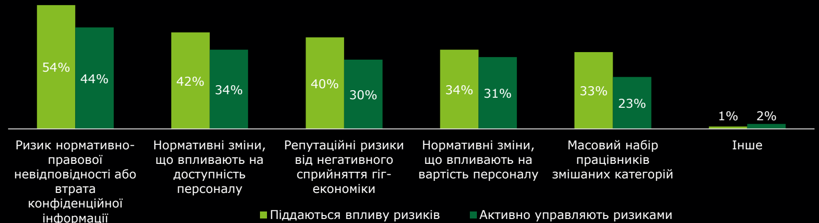
Ризики, яким піддаються компанії в управлінні змішаними категоріями працівників

Та лише 10% респондентів говорять про те, що у їх компаніях є визначена стратегія та розроблена політика працевлаштування персоналу різних категорій