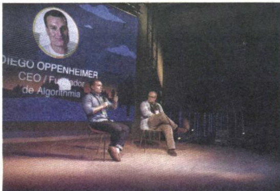
CEO de Algorithmia, Diego Oppenheimer

ANII en Israel también proporcionó algunas cifras acerca del impacto de la alta tecnología –Hi-Tech– en la economía de Israel. El sector representa el 8,3% de los empleos, 12% del PIB empresarial y 50% de las exportaciones industriales.