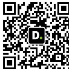
WeChat ID Deloitte Vietnam 德勤越南