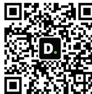
WeChat ID Deloitte SEA 德勤東南亞