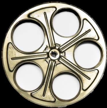
판매 등 상업 목적이 아닌 참조 목적으로 만 상용가능