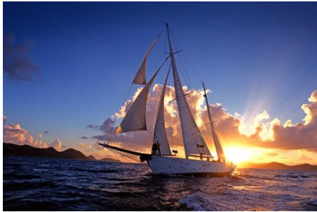
本通讯仅供专业参考，非供分发或销售