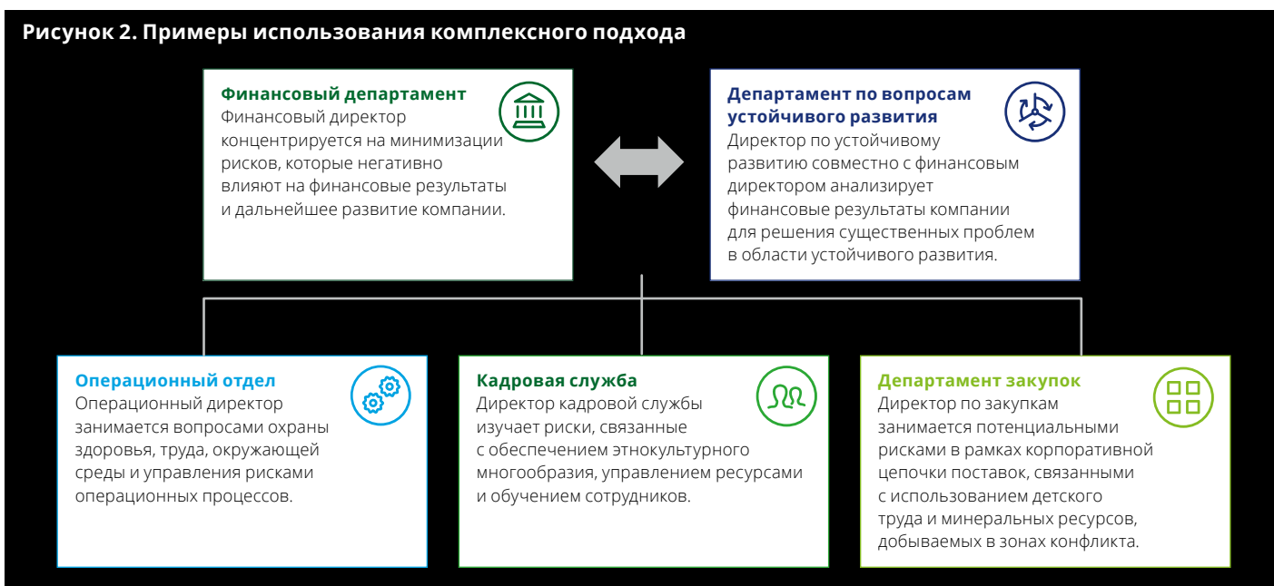
Рисунок 2. Примеры использования комплексного подхода

Координация данных мер внутри компании имеет важное значение и позволяет не упустить возникающие возможности и избежать предоставления противоречивой информации сотрудникам организации и участникам рынка. Более того, это помогает объединить инициативы в области устойчивого развития с прочими стратегическими инициативами компании и использовать более зрелый подход к повышению акционерной стоимости с учетом принципов устойчивого развития, одновременно создавая конкурентные преимущества для организации.