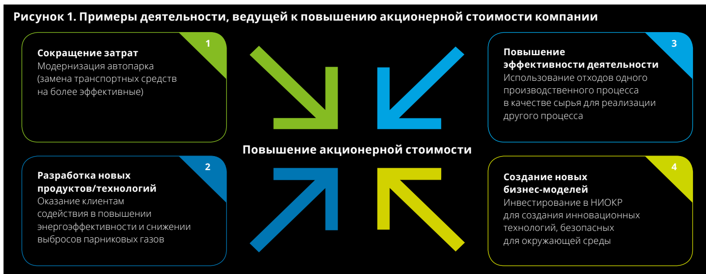
Рисунок 1. Примеры деятельности, ведущей к повышению акционерной стоимости компании

Такие действия одновременно помогают достичь и другой цели — предотвратить нанесение потенциального ущерба бренду и репутации компании, который часто сопутствует рискам в области устойчивого развития.